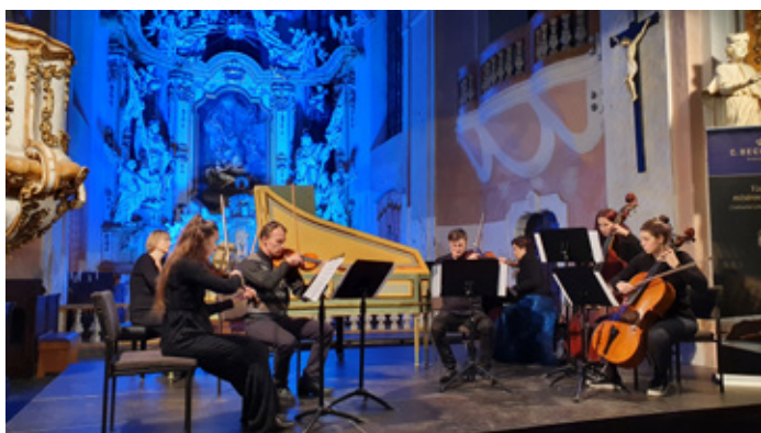
Zahajovací koncert v kostele sv. Mikuláše v Dobřanech