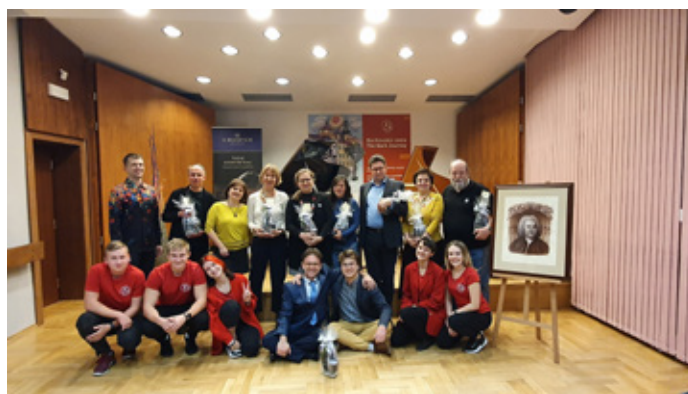
Mezinárodní porota s členy organizačního týmu

Od 4. do 7. listopadu 2021 se v prostorách základní umělecké školy konal 2. ročník mezinárodní bachovské soutěže pro děti a mladé s názvem Bachovská cesta, kterou pořádá nadační fond Bachova akademie Dobřany ve spolupráci se ZUŠ J. S. Bacha Dobřany.