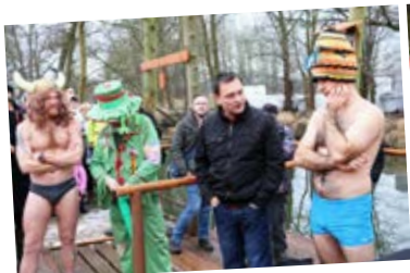
starosta mezi otužilci

K rozhovoru patří také fotografie. Těch pracovních - oficiálních jste měli možnost vidět v DL poměrně dost, a proto jsme Martinovi i Vám připravili malé překvapení. Naši fotografové Petr Šístek a Kuba Urbanec prošli své archivy a máte před sebou TOP výběr z téměř tří desítek fotografií, které ukazují různé tváře „našeho“ starosty.