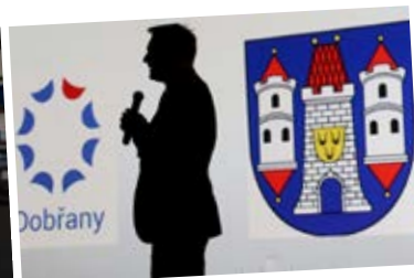
stínový starosta :-)

Na Pančavě i přes slibované restriktce se neustále parkuje na nebezpečných místech, např. kolem školní jídelny. Bude v roce 2017 důslednější hlídání těchto přestupků?