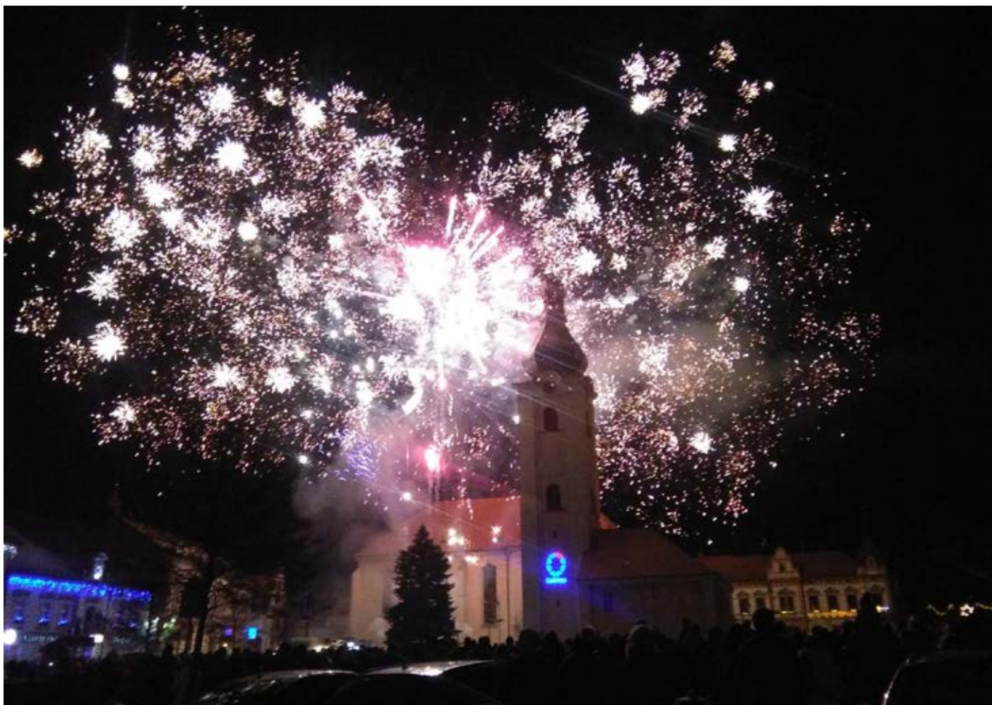
Foto: Ondřej Denk, vítěz fotosoutěže o „nej“ fotografii novoročního ohňostroje