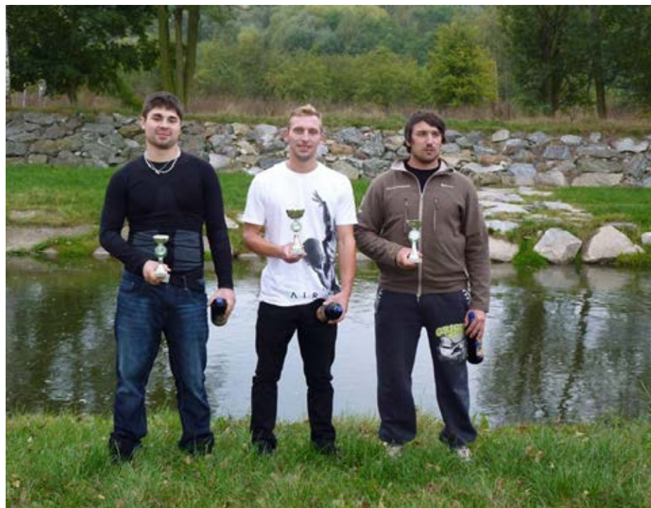
Krajský přebor na řece Úslavě