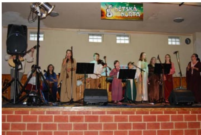
Mladší kapela Dé Domhnaigh

(vom) Z oblastního kola Dětské Porty, která se konala v Plzni, si mladší členové keltské skupiny Dé Domhnaigh při ZUŠ J. S. Bacha Dobřany přivezli několik cen. Vyhráli a postoupili do celorepublikového klání, získali 1. cenu v divácké soutěži a zvláštní cenu za vizuální dojem. Gratulujeme a držíme palce!