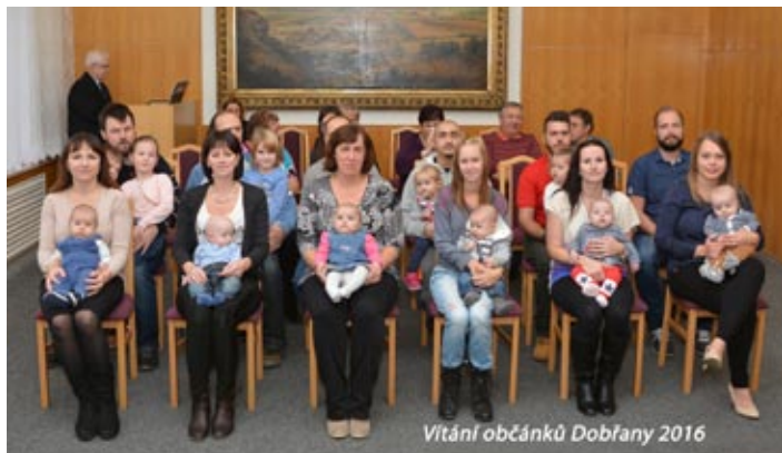
Vítání občánků Dobřany 2016