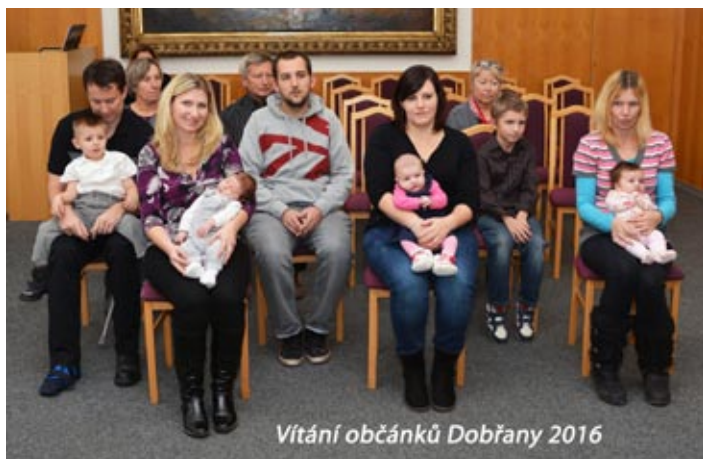
Vítání občánků Dobřany 2016