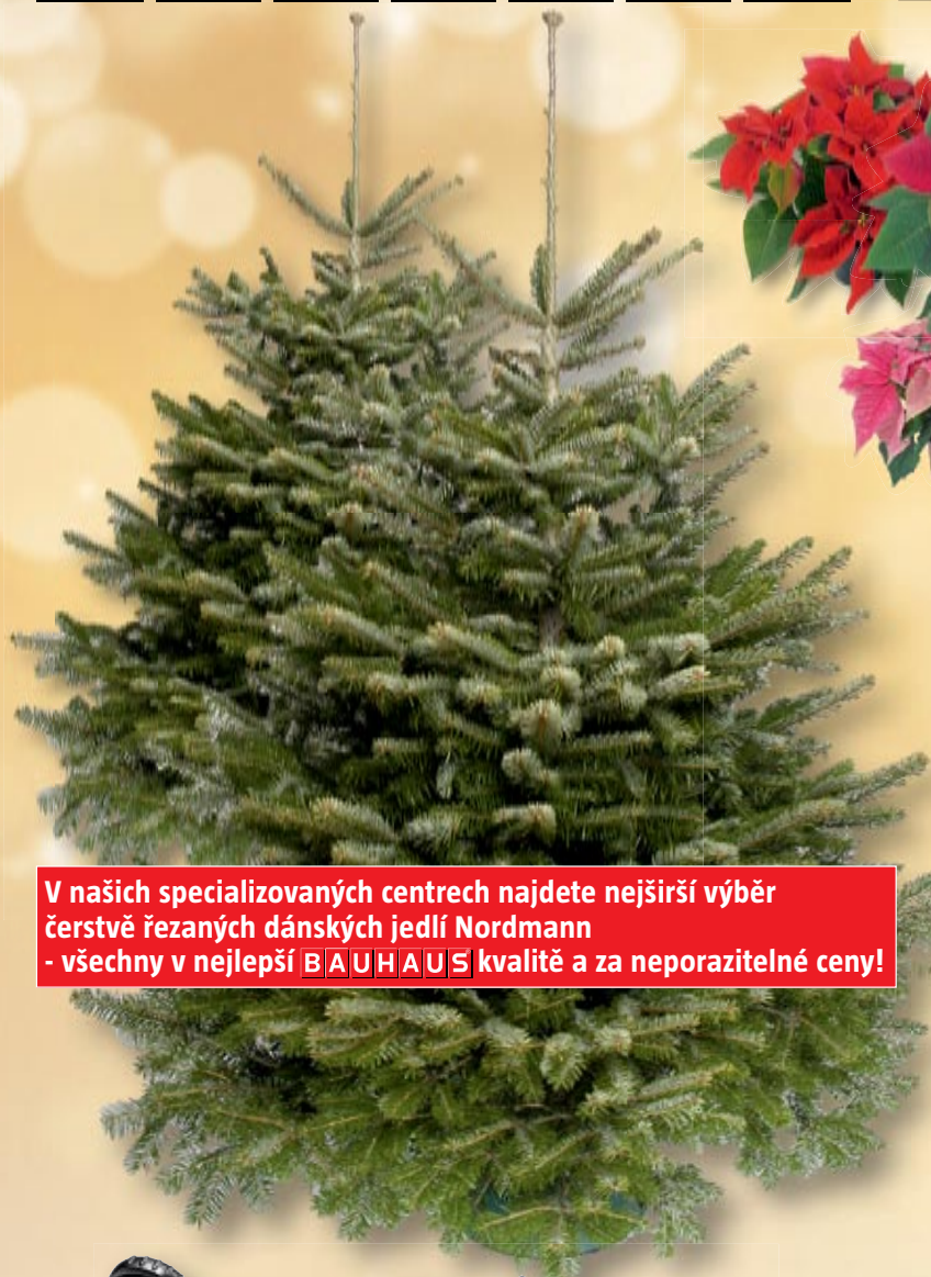
Vánoční hvězda různé barvy a velikosti, široký výběr

V našich specializovaných centrech najdete nejširší výběr čerstvě řezaných dánských jedlí Nordmann - všechny v nejlepší BAUHAUS kvalitě a za neporazitelné ceny!