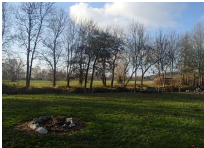
Stav plovárny - říjen 2016