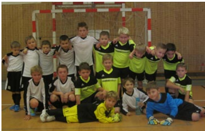
Turnaj ve Štěnovicích