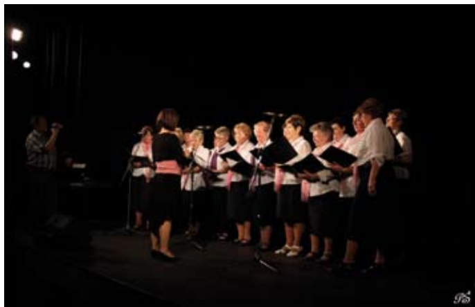
Bábinky zahájily své oslavy sborovým zpěvem.