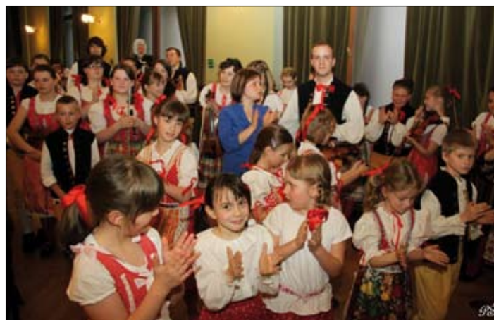
Lidová muzika Vozembach před svým vystoupením v Měšťanské besedě v Plzni (23. 3. 2014) na tradičním „Setkání lidových muzik“.