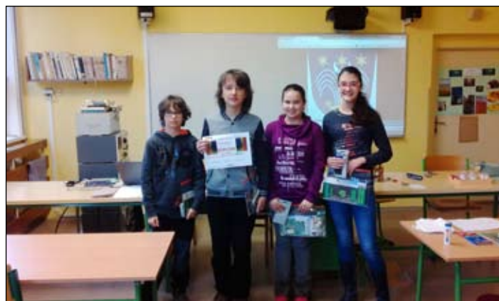
Dobřanští vítězové letinské Burzy nápadů