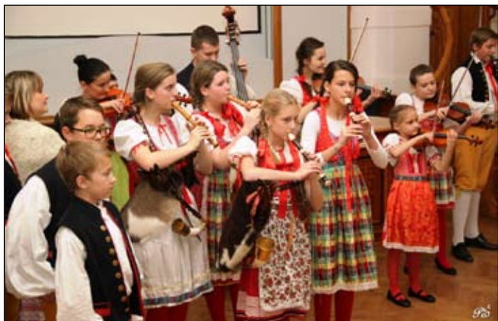
Dětská lidová muzika Vozembach zahrála během slavnostního zahájení Plzeň 2015 - EHMK (doprovodný program v Západočeském muzeu 17. 1. 2015).