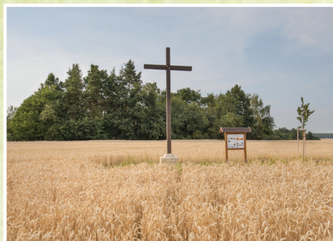
3. U kříže smíření