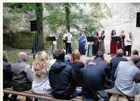
14. Divadlo pod skalami