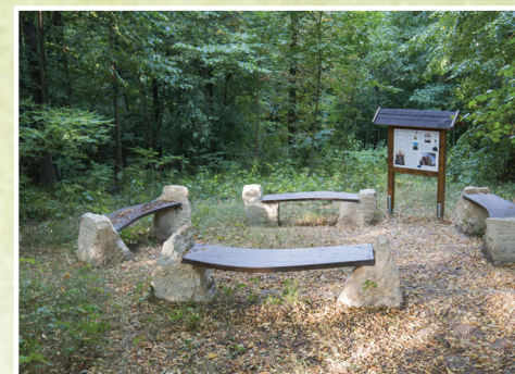
5. Dobřanské baroko