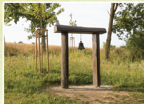
4. Přerušená polní cesta