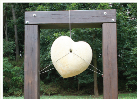
12. Srdce parku