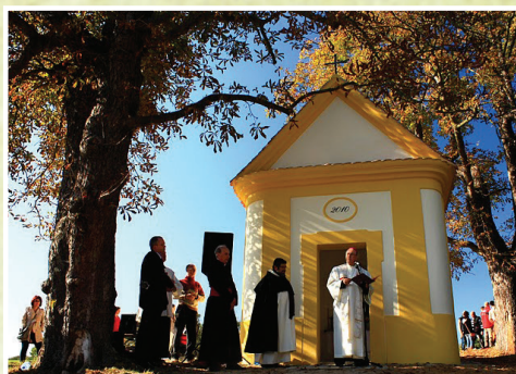
2. Znovuzrozená kaple Čtrnácti sv. pomocníků v nouzi