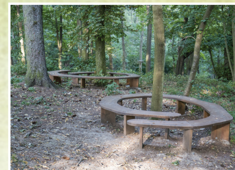
6. Uprostřed stromů