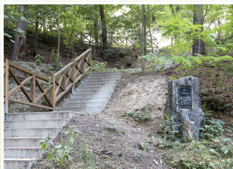
13. U pomníku Hermanna Lönse