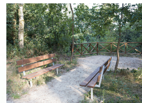
8. U vyhlídky