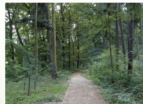
10. Procházka jírovcovým stromořadím