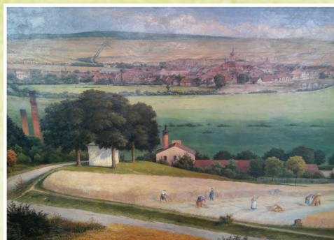
1. Obnova lesoparku Martinská stěna